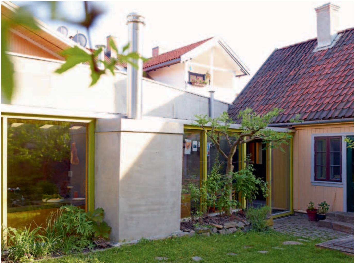
Nytt møter gammelt. En tre meter høy brannmur avgrensner tomten og skjermer for innsyn fra naboene i øst. Tilbygget er plassert der det riktig gamle dager sto et fjøs. De store glassflatene gir god kontakt både med hagen og med hovedhuset.

T ilbygget er ti meter langt, halvannen meter bredt og består for det meste av betong. En mørk, trang og kald korridor, skulle en tro. Virkeligheten er motsatt.