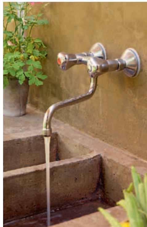
Rått og integrert. Rør og armaturer er integrert i primærkonstruksjonen, altså betongen. Det røffe uttrykket samsvarer med følelsen av å være på et utekjøkken. Fraværet av utføring bidrar også til å spare verdifull plass.